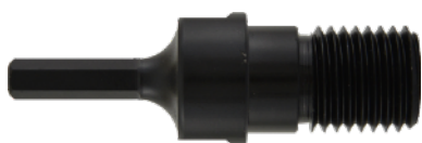
Adapter 1 1/4+1/2 na Hex cena 47 netto