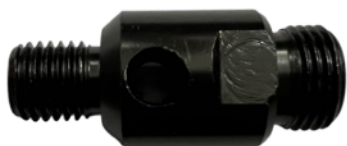
Adapter M16 na 1/2 BSP cena 40 netto