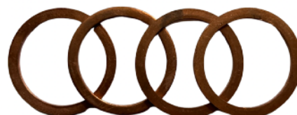
Miedziane podkładki 1 1/4 cena 3 netto/sztuka