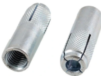
Kotwy M12 cena 2,50 netto/sztuka