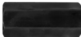
Adapter mufa z 1 1/4 na 1/2 cena 79 netto