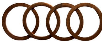
Miedziane podkładki 1 1/4 cena 3 netto/sztuka