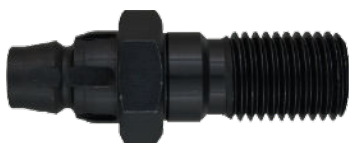
Adapter Hilti Bi+ na 1/1/4+R 1/2 cena 315 netto