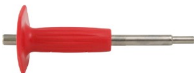
Pobijak M12 cena 105 netto