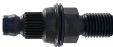
Adapter Hilti Bu na 1 1/4+R 1/2 cena 315 netto