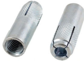
Adapter M16 na HEX cena 20 zł netto