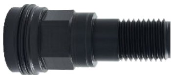
Adapter Hilti BI na 1 1/4+R 1/2 cena 368 netto