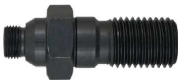
Adapter chop z 1 1/4 na 1/2 cena 79 netto