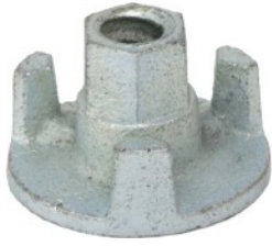
Adapter M16 na 1/2 BSP cena 40 netto