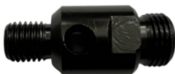
Adapter M16 na 1/2 BSP cena 50 netto