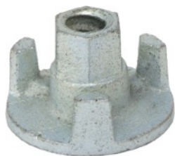
Nakrętka do śruby mocującej 32 netto