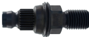
Adapter Hilti Bu na 1 1/4+R 1/2 cena 350 netto